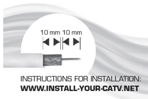
Schéma de câblage

Replier la tresse (retirer la feuille extérieure des câbles)